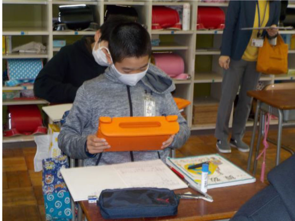
6年1組 算数 「反比例の関係に気付こう」