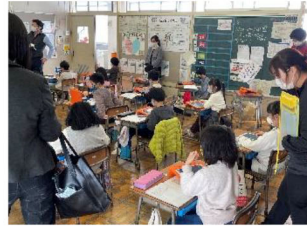
参 観 風 景