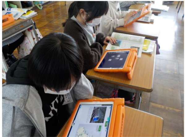
4年2組 社会 「新潟県の交通について調べよう」