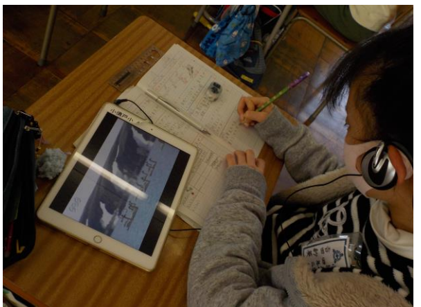
4年2組 理科 「冬に見られる鳥のくらし」