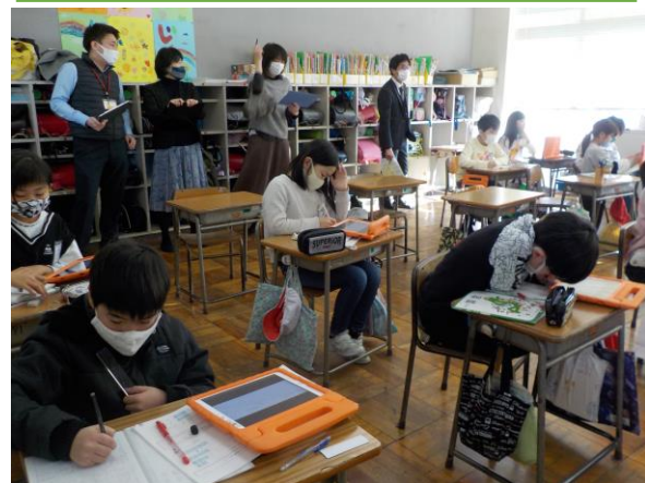
4年1組 国語 「音声ヒントを手掛かりに考えよう」