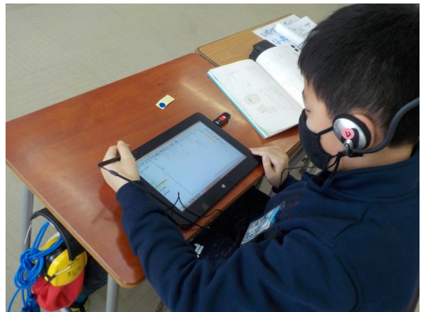
あおぞら2組 国語 「自分の読みを確かめよう」