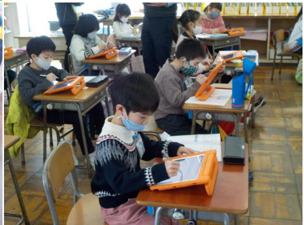
2年2組 算数 「テープ図の長さ比べ」