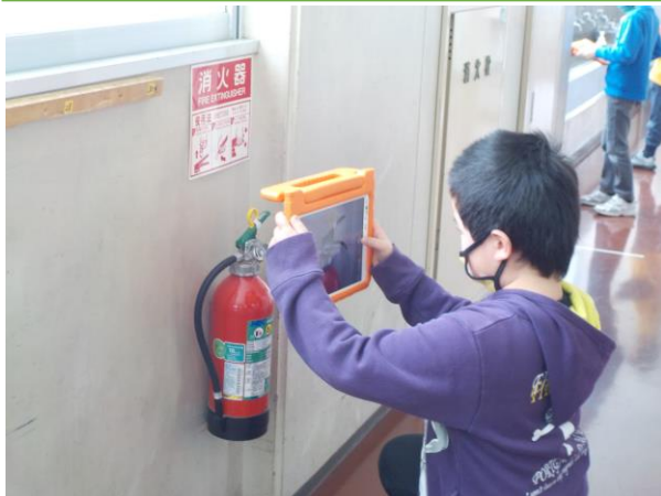
2年1組 図工 「顔に見える形を探そう」